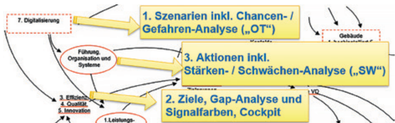
Abb. 3 Die Erfolgslogik unterstützt bei der Szenarioarbeit (z. B. durch »Vorwärtslesen« entlang der Wirkungsketten) und deren Übersetzung in realistische Ziele und dazu passende Maßnahmen

1. Szenarioarbeit dient dazu, in Kombination mit einer Erfolgslogik komplexe Zusammenhänge besser zu verstehen und zukünftige Risiken und Chancen frühzeitig zu erkennen. Die Visualisierung der erfolgsrelevanten Elemente und deren Zusammenhänge in einer Erfolgslogik ermöglicht eine um-