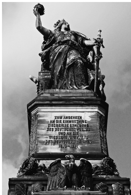
Das Kaiserreich und seine Symbole der Einheit: Niederwalddenkmal weit Rüdesheim am Rhein, vollendet 1883, Planung von Karl Weißbach, Skulpturen von Johannes Schilling

Die vier Milliarden Goldmark der französischen Kriegskontributionen nach dem deutschen Sieg von 1871 wurden zu einem großen Teil zur Entschuldung der Bundesländer verwendet, wodurch sich die Liquidität des privaten anlagesuchenden Kapitals erhöhte. Das investierte nun übermäßig in private Eisenbahngesellschaften und Schwerindustrie, was im Oktober 1873 zu einem Börsenkrach mit plötzlichem Kursverfall führte, Zusammenbruch vieler neu gegründeter Unternehmen, dem Verlust von Ersparnissen nicht weniger Bürger, einem allgemeinen Stimmungsumschwung und damit zu