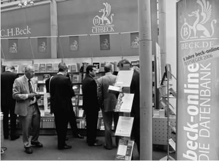
Fünffähriges Jubiläum von beck-online. Präsentation beim Deutschen Anwaltstag in Köln.

NJW als überspannende Zeitschrift für alle Sachgebiete und als die fast schon zwingende Grundlektüre für die Anwaltschaft wichtig. Auch konnten die Zeitschriftenneugründungen aus den 1980er Jahren, wie zum Beispiel die Neue Zeitschrift für Verwaltungsrecht, Neue Zeitschrift für Arbeitsrecht, Neue Zeitschrift für Strafrecht usw., mit ihren Rechtsprechungs- und Aufsatzinhalten gut genutzt werden.