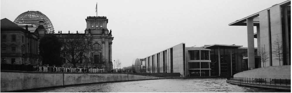
Berlin wird Hauptstadt. 1999 nehmen Regierung und Parlament dort ihre Arbeit auf. Links das Reichstagsgebäude mit der Kuppel von Norman Foster, rechts das Marie-Elisabeth-Lüders-Haus von Stephan Braunfels, in der Mitte der Spreebogen.

als Bundes- oder Landesrecht weiter. Im Übrigen aber trat bundesdeutsches Recht in Kraft.