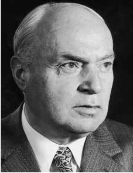
Hermann Bengtson, Herausgeber des «Handbuchs der Altertumswissenschaft»

Die Freiemplare, die Bengtson von seiner «Einführung in die Alte Geschichte» 1949 über den Verlag versenden ließ, erreichten einen weiten Kreis von deutschen und ausländischen Wissenschaftlern und trugen maßgeblich dazu bei, dass der Autor und der Verlag wieder in der internationalen scientific community wahrgenommen wurden. Zu den Empfängern zählten große Namen: Michael Rostovtzeff und Charles Bradford Welles