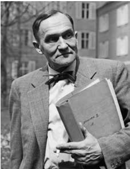
Heimito von Doderer mit dem Manuskript der «Dämonen» vor dem Verlagsgebäude

1956 erschienen «Die Dämonen», die nicht nur von der Ostmark gereinigt waren. Der Roman kam zur rechten Zeit, um Doderer in seiner Heimat zum Nationaldichter zu machen. Seit dem Staatsvertrag vom 15. Mai 1955 war Österreich wieder souverän. Hatte der österreichische Buchhandel 1951 gerade einmal 500 Exemplare der «Strudlhofstiege» bestellt, so war es nun die dreifache Zahl. 45 «Die Chronik des Sektionsrates Geyrenhoff» bot nicht nur ein grandioses Panorama der Wiener Gesellschaft, sondern spiegelte in literarischer Verfremdung auf 1300 Seiten die österreichische Zeitgeschichte. Der Roman fand aber nicht nur in seiner Heimat ein großes Publikum, sondern wurde auch in Deutsch-