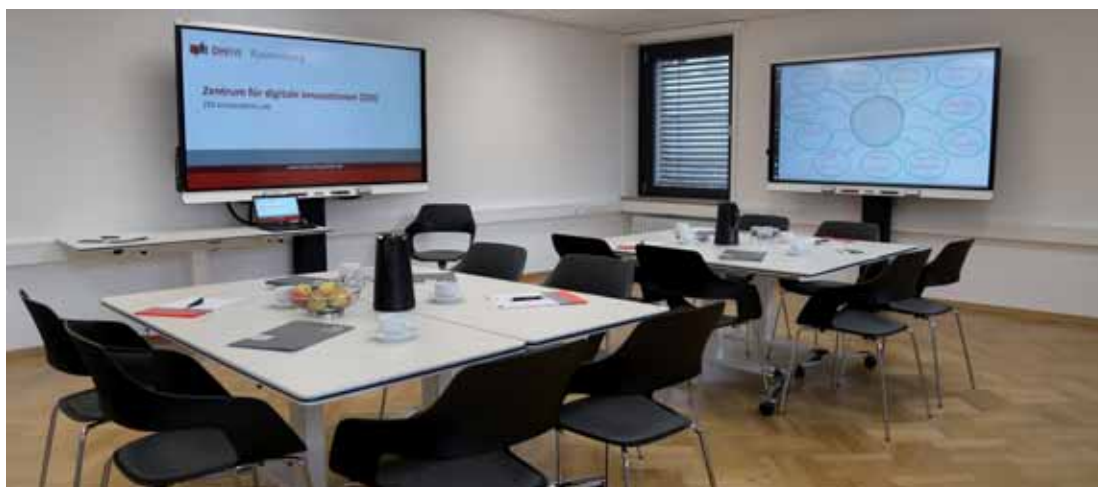
Abb. 2: ZDI Innovation Lab