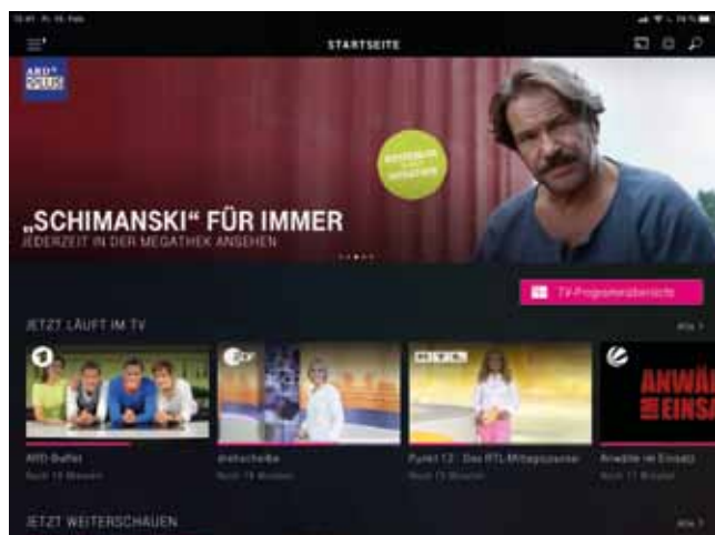
Startseite Magenta TV (iPad App)

nächsten Zeit einen Fokus darauf legen, sie programmlich und technisch zu stärken.