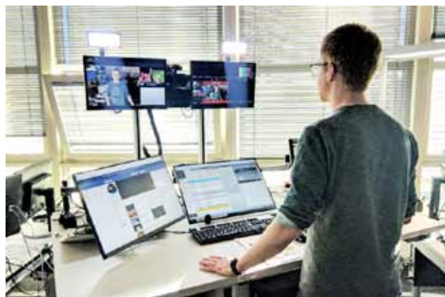
Abb.3: Assistierte Arbeitsumgebung für den Selbstfahrer am Moderationsplatz