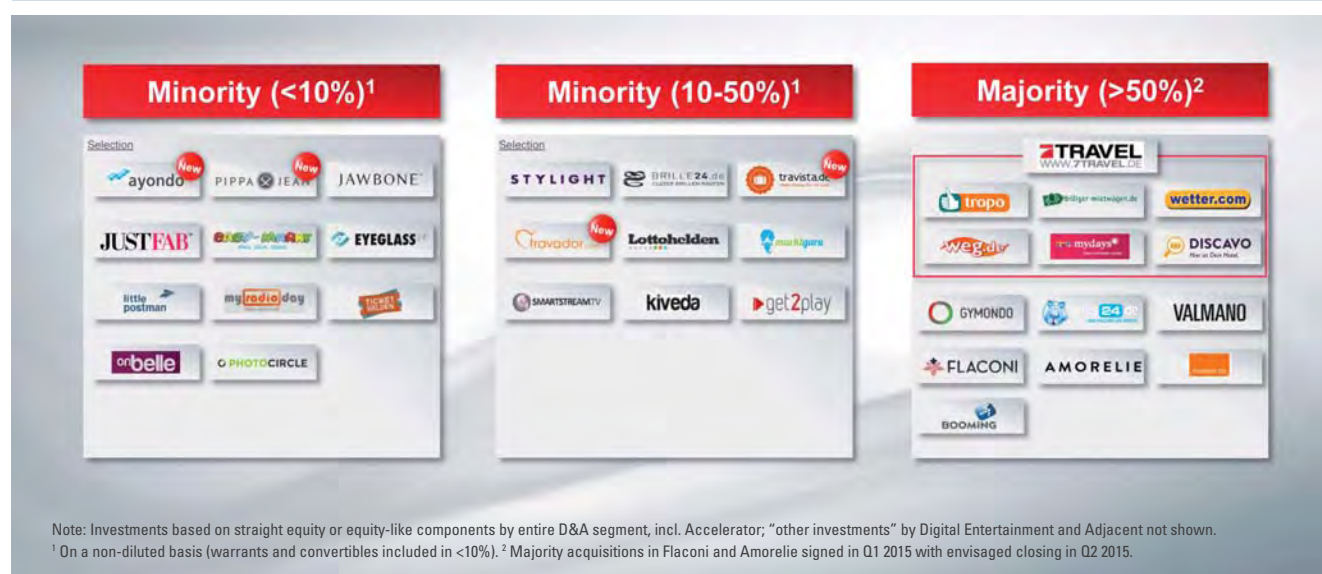
Abb. 3: Das digitale Beteiligungs-Portfolio von ProSiebenSat.1