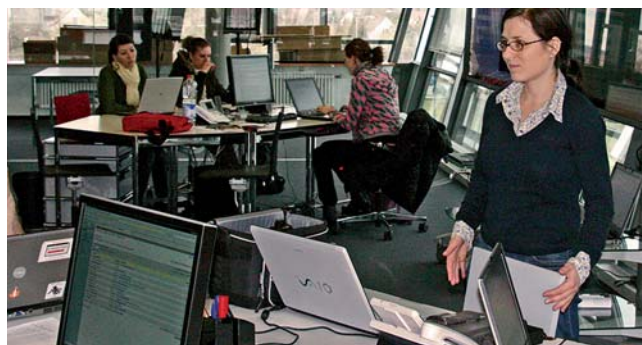
Themendiskussion mit dem CvD

Zu Beginn eines Semesters erfolgt dementsprechend mehr Input durch die Professoren, schrittweise wird dieser durch