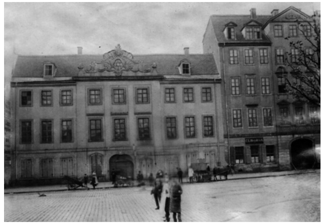
Abb. 3: Sitz der HHL in der Löhrstraße (1898–1901)