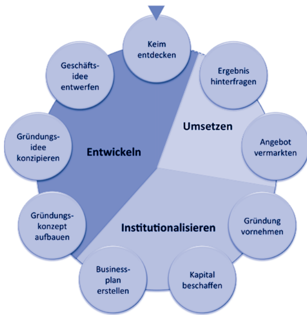
Abb. 1: Etappen und Schritte auf dem Weg zum Geschäftsbetrieb eines Startups

erlebten sie innovative Prozesse. Nebenjobs haben sie nicht nur aus finanziellen Gründen ausgewählt, sondern auch, um sich auf verschiedenen Gebieten auszuprobieren. Dabei wurden Prozesse verstanden, Projektmanagement erlebt und vor allen erfahren, wie Ideen im Hinblick auf ihre ökonomische Verwertbarkeit zu beurteilen sind.