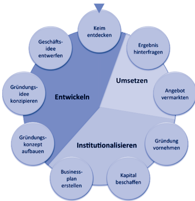
Abb. 1: Etappen und Schritte auf dem Weg zum Geschäftsbetrieb eines Startups

erlebten sie innovative Prozesse. Nebenjobs haben sie nicht nur aus finanziellen Gründen ausgewählt, sondern auch, um sich auf verschiedenen Gebieten auszuprobieren. Dabei wurden Prozesse verstanden, Projektmanagement erlebt und vor allen erfahren, wie Ideen im Hinblick auf ihre ökonomische Verwertbarkeit zu beurteilen sind.