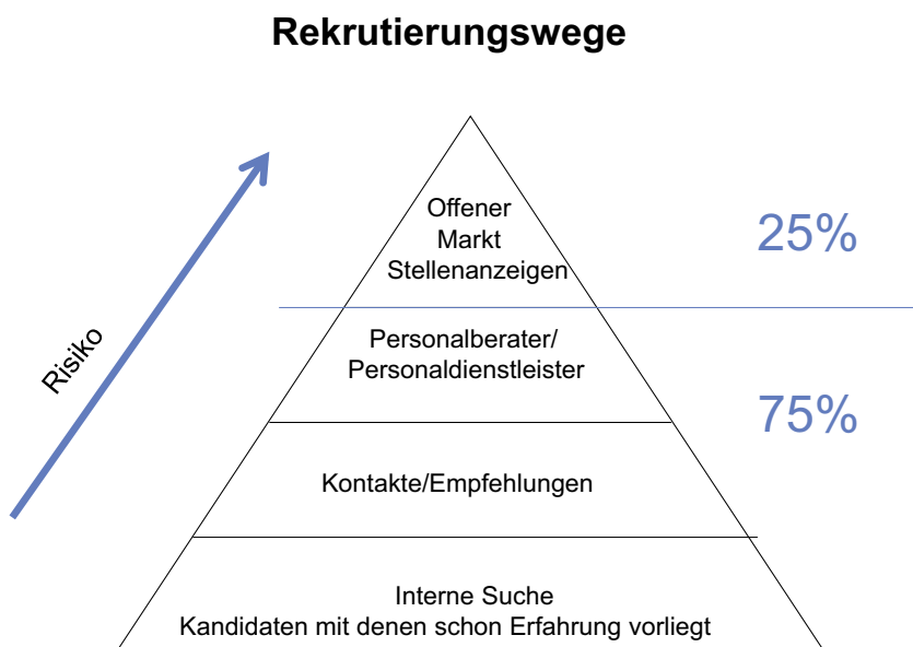
Abb. 2: Rekrutierungswege

Wer über ein gutes Netzwerk verfügt, erfährt bereits von Stellen, die noch nicht offiziell ausgeschrieben sind oder wird sogar direkt angesprochen. Viele Unternehmen bitten ihre Mitarbeiter ganz konkret um Kandidatenvorschläge. Daher ist der Kontakte zu ehemaligen Studienkollegen hier eine gute Möglichkeit ins Gespräch gebracht zu werden. Kontakte lassen sich auch sehr gut auf Fach- oder Rekrutierungsmessen knüpfen. Bei der Kontaktaufnahme wird die eigene kurze Vorstellung von entscheidender Bedeu-