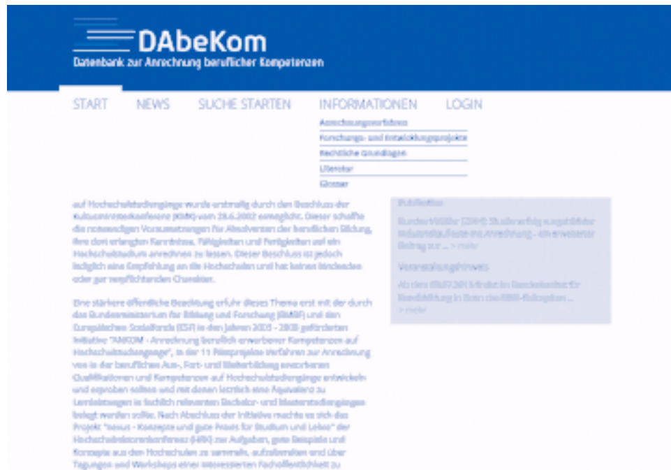
Abb. 1: Screenshot Startseite DAbeKom

auf Studiengänge an deutschen Hochschulen zusammengestellt und abrufbar gemacht (vgl. Abb. 1).